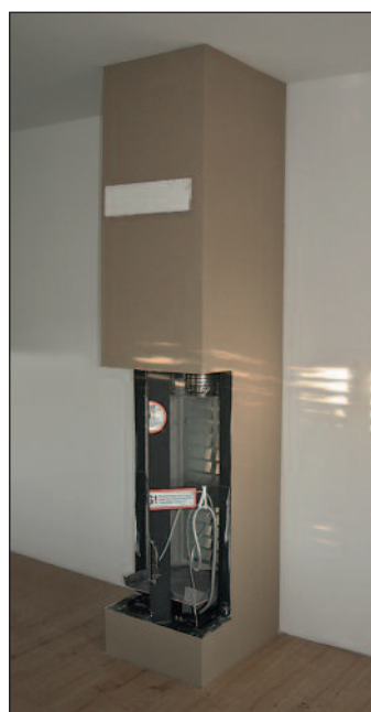
Vollständige Seitenansicht rechts