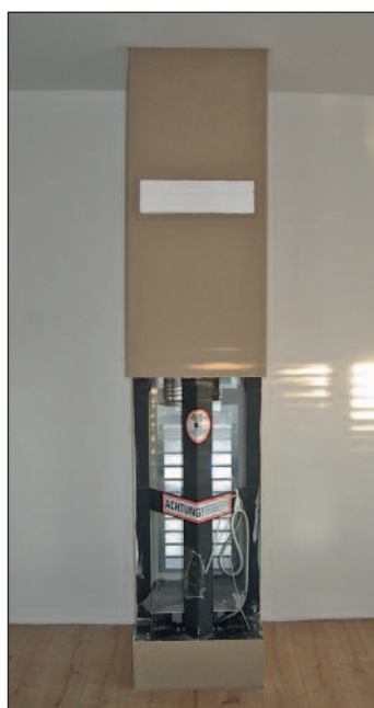
Vollständige Ansicht der Frontseite