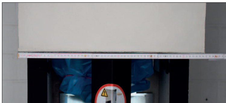
Detailansicht des Außenmaßes der fertigen bauseitigen Verkleidung